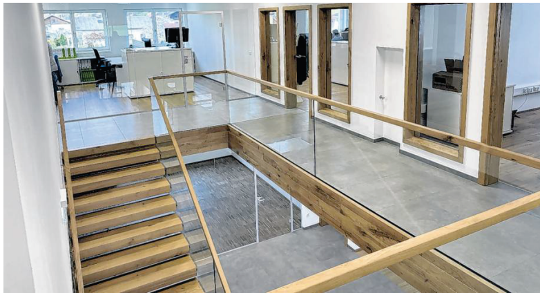
Am neuen Standort befinden sich moderne Büros mit Wohncharakter.