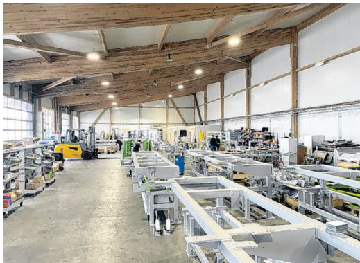
Die neue Halle bietet genug Platz für die Anlagenmontage.

Das Unternehmen beschäftigt weltweit rund 1100 Mitarbeiterinnen und Mitarbeiter. Weitere Infos findet man unter wintersteiger.com.